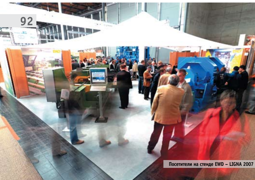
Посетители на стенде EWD – LIGNA 2007

Во всем мире представители лесоперерабатывающей промышленности с нетерпением ждут открытия отраслевой выставки LIGNA, которая пройдет в Ганновере (Германия) с 18 по 22 мая. По оценкам организаторов форума, центром внимания многочисленных специалистов и посетителей, которые приедут в Ганновер со всех концов мира, обещает стать павильон № 27. На площадках этого павильона будут сосредоточены самые современные и высокоэффективные разработки компаний-лидеров, выпускающих лесопильное оборудование. Именно здесь, среди экспозиций лучших из лучших, на стенде D53, будет представлена продукция компании EWD, специализирующейся на производстве и поставке под ключ лесопильных предприятий.