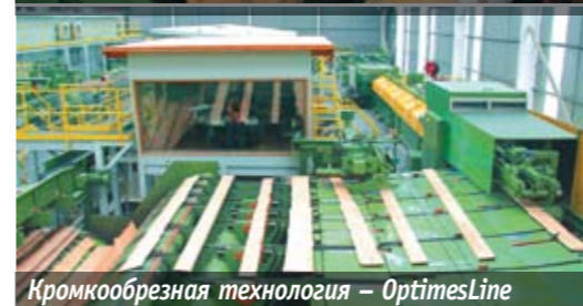
Кромкообрезная технология – OptimesLine