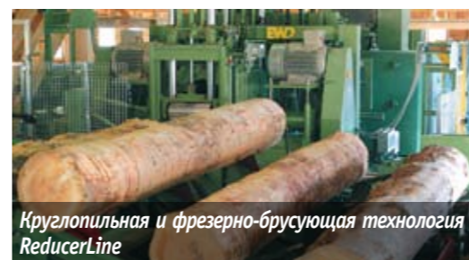
Круглопильная и фрезерно-брусующая технология – ReducerLine

Переработка пиловочника ведется при скорости подачи 150 м/мин. Следует отметить, что в г. Усть-Куте строится также линия для переработки толстомерной древесины на базе ленточно-пильной, круглопильной, профилирующей и кромкообрезной техники, которая позволит получать высококачественные пиломатериалы радиального распила.