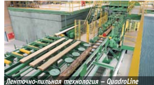
Ленточно-пильная технология – QuadroLine

Особый интерес оборудование EWD представляет для средних лесопильных предприятий с ежегодными объемами переработки от 100 до 300 тыс. м 3 сырья. За последние несколько лет специалисты компании накопили значительный опыт именно в этом сегменте лесоперерабатывающей отрасли, поэтому особое внимание они уделяют тщательному планированию и четкому проектированию.